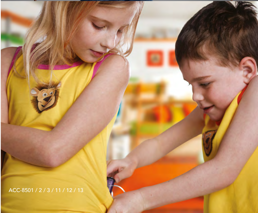
ACC-8501 / 2 / 3 / 11 / 12 / 13

Ce débardeur en coton doux est doté de deux poches pour la pompe à insuline de chaque côté. L'ouverture se situe à l'extérieur et la tubulure se place simplement à l'intérieur du débardeur. Coton 95%, élasthanne 5%. Lavable en machine.